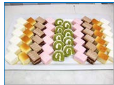
ケーキ盛り合わせ

グランエターナサービス拓殖大学文京キャンパス店では パーティー等承っておりますので、お気軽にお問い合わせ下さい。