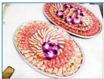
スモーク鴨とコールミート