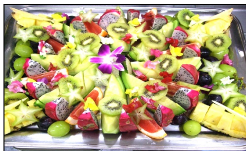
フルーツ盛り合わせ