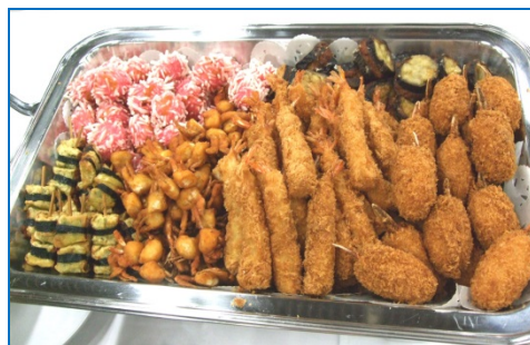
各種揚げ物 盛り合わせ