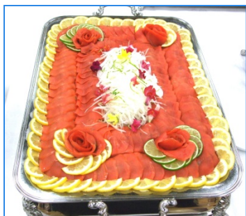
スモークサーモン