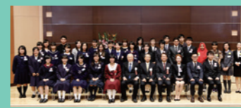
表彰式 拓殖大学文京キャンパス