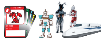
トレカ・フィギュア・模型

万年筆 / 和装小物 / ゴルフ / バイオリン / ギター / スマホ / タブレット / 工具 / 喫煙具 (Zippo) 他、ご相談ください