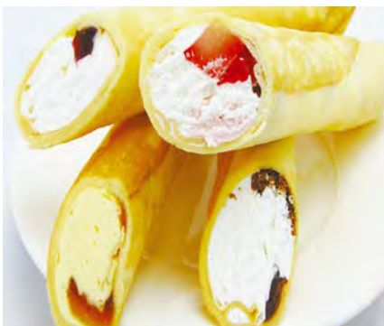
スティック・アイス・クレープ 220円