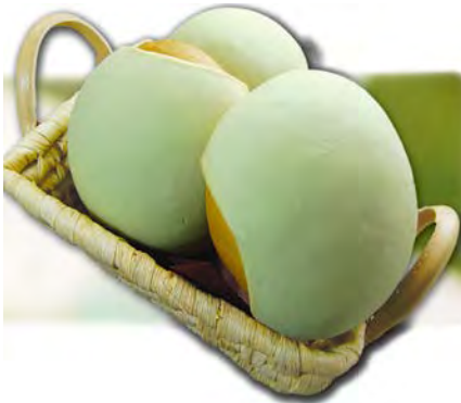
富良野メロンパン 170円