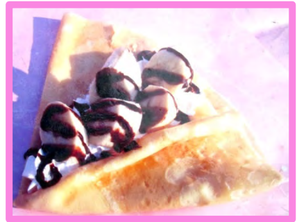
人気No.1 チョコバナナ ホイップ 500円 (-50円)