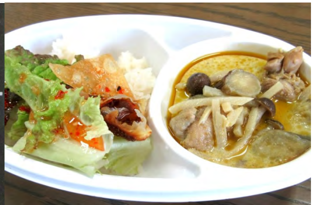
グリーンカレー 500円

グリーンカレー タイ料理王道のグリーンカレー 具沢山で食べごたえあり！ ピリッとウまい～