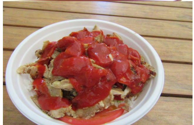
ライスメニュー ケバブ丼 700円