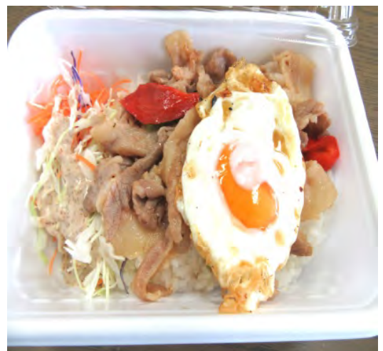
タイ風スタミナ丼 500円 たまーにしかないかもしれませんm(_ _)m