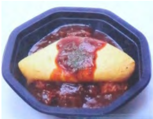
ビーフデミグラス650円