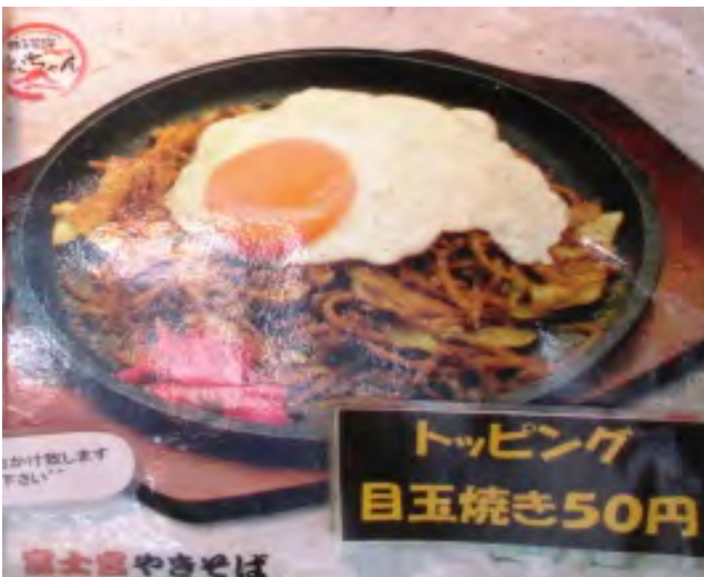
目玉焼き乗せ 50円増