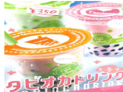
タピオカジュース 350円