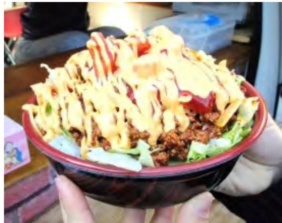
ダブルチーズ 大盛り