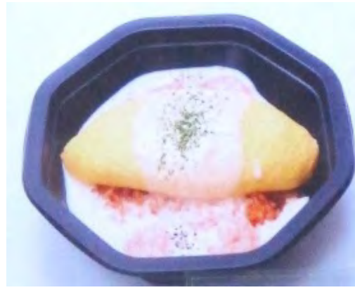
シュリンプホワイト650円