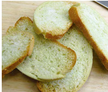
メロンパンラスク 210円