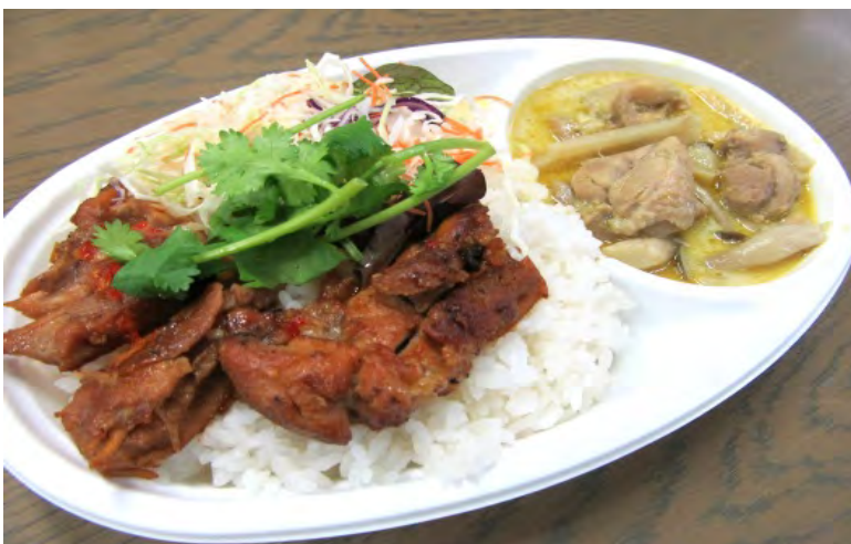
ガイヤーン・グリーンカレー 600円 人気のメニューを両方楽しむことができます！