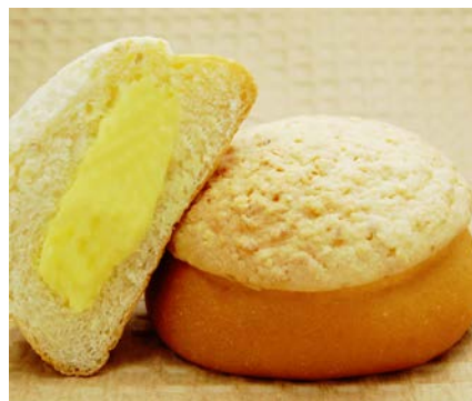
リッチカスタードメロンパン 210円