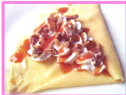
お薦めのクルミ&キャラメル 450円 (-50円)