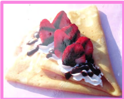
人気のチョコイチゴホイップ 500円 (-50円)