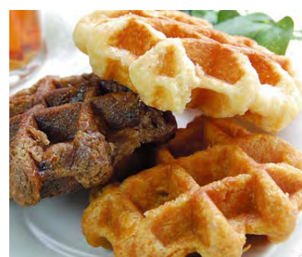
レッカー・ワッフル 190円

・その他 季節商品 季節のメロンパン 210円 や クロワッサン、海軍カレーパン、チーズケーキ 各種ソフトクリームなども販売することがあります。