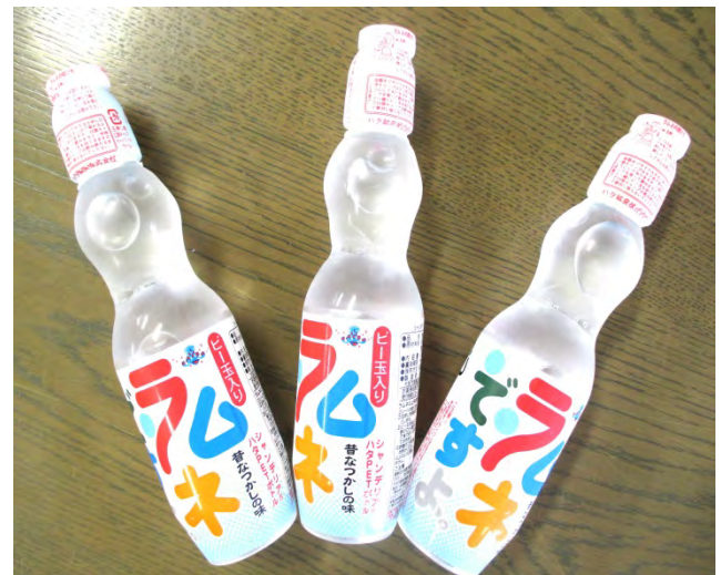
真夏の季節商品 「昔なつかし」のラムネ 150円 ご提供していない場合があります