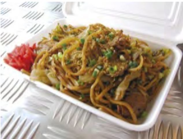
富士宮やきそば 500円