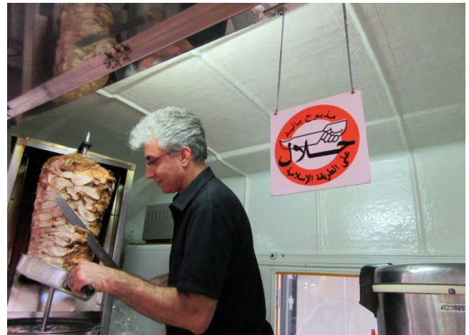
全てのメニューがハラールになります