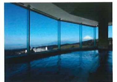
展望温泉大浴場イメージ