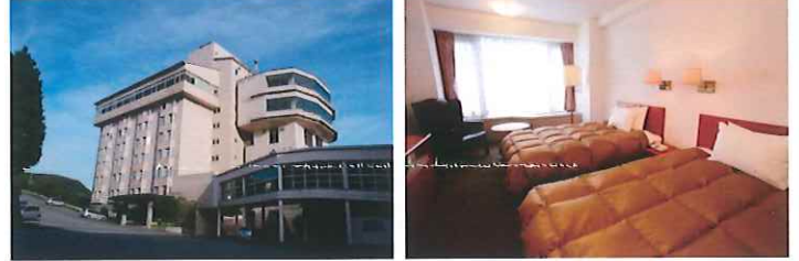
別館スコレプラザホテル外観・客室イメージ