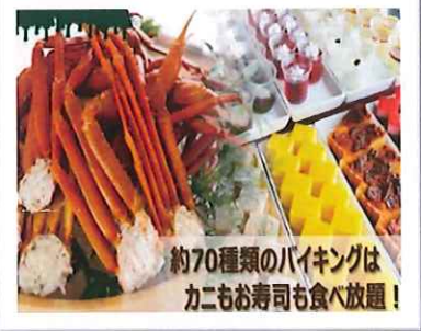
バイキングプランイメージ