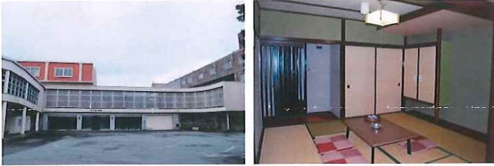
本館ホテル富士箱根外観・客室イメージ