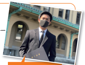
在疫情期間我在別科努力學習。

我從小時候開始就非常喜歡日本動漫和日本文化，來日本之前就開始學習日語。在印尼教我日語的老師告訴了我拓殖大學的別科，我自己也查了一下後決定入讀。在別科有日語能力試驗對策班和大學升學班等各種課程可以選擇。另外老師們對每個學生都很關心，自己想說的話也可以輕鬆說出來。透過別科的推薦制度，我升入拓殖大學商學部。在大學學習國際商務，將來想在日本的公司工作。