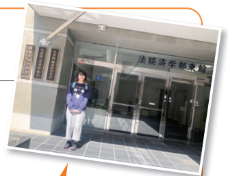
如願考入了志願學校。

在大學社團遇到過各種各樣的留學生，受此影響我決定前往日本留學。之所以選擇拓殖大學別科日語教育課程，是因為曾在別科學習的大學時代前輩向我介紹的。在別科，不僅有老師教我們日語，還可瞭解日本概要和升學準備，還會對我們生活上的事情和困難提供幫助。能和來自世界各國的同學們相遇真是太棒了。另外，在校舍附近的留學生宿舍透過努力學習，並在別科的推薦下我獲得了民間團體獎學金。