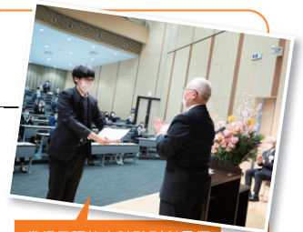
獲得日語能力試驗別科最優秀獎。

我從以前開始就對日本文化感興趣，所以決定選擇日本挑戰留學。我之所以知道拓殖大學別科日語教育課程，是因為父親的熟人推薦的。別科的老師們會很親切地回答學生們的問題，很清楚學生們感到困難的事情並提供幫助。別科不僅是學習，還會舉辦研修旅行和派對等活動，所以有很多體驗日本文化的機會。因為也可以使用拓殖大學的設施，所以我透過努力學習，獲得了別科的日語能力試驗最優秀獎。