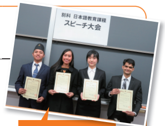
在演講比賽上獲得最優秀獎。

我從小學開始經常和父母一起去日本，因為對日本很有感情，所以決定前往日本留學。之所以選擇拓殖大學別科日語教育課程，是因為有升學到別科的朋友推薦。拓殖大學的學生每週會來一次別科擔任授課助理。透過和日本學生的交流，我的日語進步很快，也更瞭解了日本文化。另外，別科學費比日語學校便宜，上課時間也長，可以根據個人情況選擇課程非常不錯。