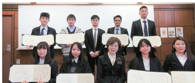
畢業典禮後的班會