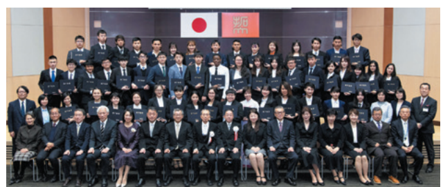
พิธีมอบประกาศนียบัตรผู้สำเร็จการศึกษา