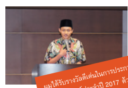
ผมได้รับรางวัลดีเด่นในการประกวดสุนทรพจน์ประจำปี 2017 ด้วยครับ

สมัยเรียนชั้นมัธยม ผมเรียนสายวิทยาศาสตร์และรู้สึกชอบเกี่ยวกับฟิสิกส์เป็นพิเศษครับ เนื่องจากผมต้องการเดินทางมาเรียนที่ประเทศญี่ปุ่นซึ่งเป็นประเทศที่ขึ้นชื่อในเรื่องการวิจัยพัฒนาระดับโลก คุณครูที่อยู่อินโดนีเซียซึ่งที่เคยเรียนจบจากมหาวิทยาลัยทะเลคุโซคุเลยแนะนำให้ผมมาเรียนหลักสูตรภาษาญี่ปุ่นแบบเร่งรัดสำหรับนักศึกษาต่างชาติของมหาวิทยาลัยครับ ซึ่งหลังจากที่ได้เข้ามาเรียนผมก็มีโอกาสได้รับทุนการศึกษาจาก Takayama International Education Foundation ขณะเดียวกันคณาจารย์ประจำหลักสูตรก็ได้ชี้แนะให้ผมรู้เกี่ยวกับภาษาญี่ปุ่นและอื่นๆ เป็นอย่างดียิ่งทำให้ผมเรียนต่อในคณะวิศวกรรมศาสตร์ของมหาวิทยาลัยทะเลคุโซคุได้ในที่สุด ในตอนนี้ ผมกำลังเรียนเกี่ยวกับวิศวกรรมระบบเครื่องจักรกลครับ ส่วนในอนาคต ผมอยากจะทำนวัตกรรมการศึกษาของตัวเองในเชิงเทคนิคเพื่อให้อินโดนีเซียกลายเป็นประเทศพัฒนาเหมือนประเทศญี่ปุ่นครับ