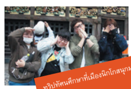
ทริปทัศนศึกษาที่เมืองนิกโกสุมูกามากา เลย์ครับ

หลังจากเรียนจบจากมหาวิทยาลัย ผมทำงานอยู่ 1 ปีก่อนออกมาเข้าร่วมโครงการท่องเที่ยวและทำงานในประเทศออสเตรเลียกับประเทศญี่ปุ่นครับ ช่วงนั้นเองที่ทำให้ผมรู้สึกชอบประเทศญี่ปุ่นเป็นอย่างมาก จนถึงกับตัดสินใจเรียนต่อที่ประเทศนี้เลยทีเดียว คนรู้จักของผมแนะนำให้ผมมาเรียนหลักสูตรภาษาญี่ปุ่นแบบเร่งรัดสำหรับนักศึกษาต่างชาติของมหาวิทยาลัยทะเลคุโซคุครับ ด้วยความที่ผมชอบคุณภาพชีวิตของญี่ปุ่น ผมเลยตั้งใจเรียนภาษาญี่ปุ่นในหลักสูตรนี้ตั้งแต่เข้าไต้หวันว่าจะเข้าเรียนในมหาวิทยาลัยคิงเป่ไต้หวันให้ได้เพื่อพัฒนาความเชี่ยวชาญเฉพาะทางเกี่ยวกับภาพยนตร์โอ ซึ่งเหล่าคณาจารย์ของหลักสูตรก็ได้ชี้แนะถ่ายทอดวิชาความรู้ให้แก่ผมเป็นอย่างดี จนทำให้ผมเข้าเรียนต่อในมหาวิทยาลัยคิงเป่ไต้หวันได้ในที่สุด ในอนาคต ผมอยากจะทำงานด้านการจัดจำหน่ายภาพยนตร์ครับ