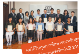
ผมได้รับทุนการศึกษาของหลักสูตรภาษาญี่ปุ่นแบบเร่งรัดประจำปี 2018 ครับ

ในตอนแรก ผมอยากแลกเปลี่ยนพูดคุยกับคนญี่ปุ่นเยอะ ครับ พอลองค้นหาข้อมูลในอินเทอร์เน็ต ผมก็ได้รับรู้กับหลักสูตรภาษาญี่ปุ่นแบบเร่งรัดสำหรับนักศึกษาต่างชาติของมหาวิทยาลัยทะเลคุโซคุและรู้สึกว่าหลักสูตรนี้ยอดเยี่ยมมากครับ หลังจากที่ได้เข้ามาเรียน เหล่าคณาจารย์ของหลักสูตรก็ได้ชี้แนะให้ผมมีความรู้ความเข้าใจในเรื่องต่างๆ เป็นอย่างดี ผมยังได้สัมผัสวัฒนธรรมญี่ปุ่นผ่านกิจกรรมต่างๆ ทั้งทริปทัศนศึกษาและงานประกวดสุนทรพจน์อีกด้วย หลักสูตรนี้มีคาบโฮมรูททุกวันพฤหัสบดี และทำให้ผมได้มีโอกาสแลกเปลี่ยนพูดคุยกับนักศึกษารุ่นพี่