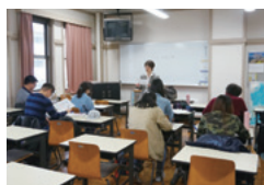
แผนการเรียนการสอน

การศึกษาต่อในมหาวิทยาลัยทะเลชุคุและอื่นๆ