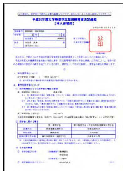
採用候補者決定通知 【本人保管用】