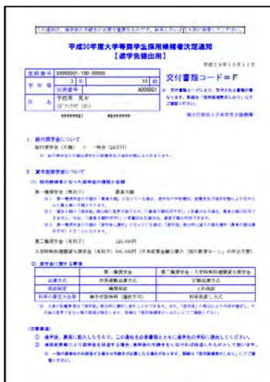
採用候補者決定通知 【進学先提出用】

「進学届」を入力する際に必要となる「識別番号」は「採用候補者決定通知【進学先提出用】」と引き替えになりますので、必ず持参してください。