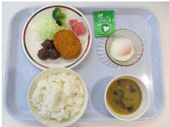
肉団子甘酢、コロッケ、温泉玉子