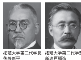
拓殖大学第三代学長 後藤新平 拓殖大学第二代学監 新渡戸稲造

拓殖大学では、全国の高校生、外国人留学生を対象に作文コンクールを実施しています。明治から大正にかけて日本が国際社会に登場していく過程で重要な足跡を残した第三代学長 後藤新平、第二代学監 新渡戸稲造の精神を受け継ぎ、「国際協力」「国際理解」「社会貢献」の重要性を広く伝え、グローバルに活躍できる人材の育成を目的に開催しているものです。テーマに沿ったたくさんの応募をお待ちしています。